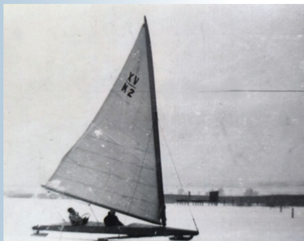
A „Fereteg” jégvitorlás 1952/53 telén