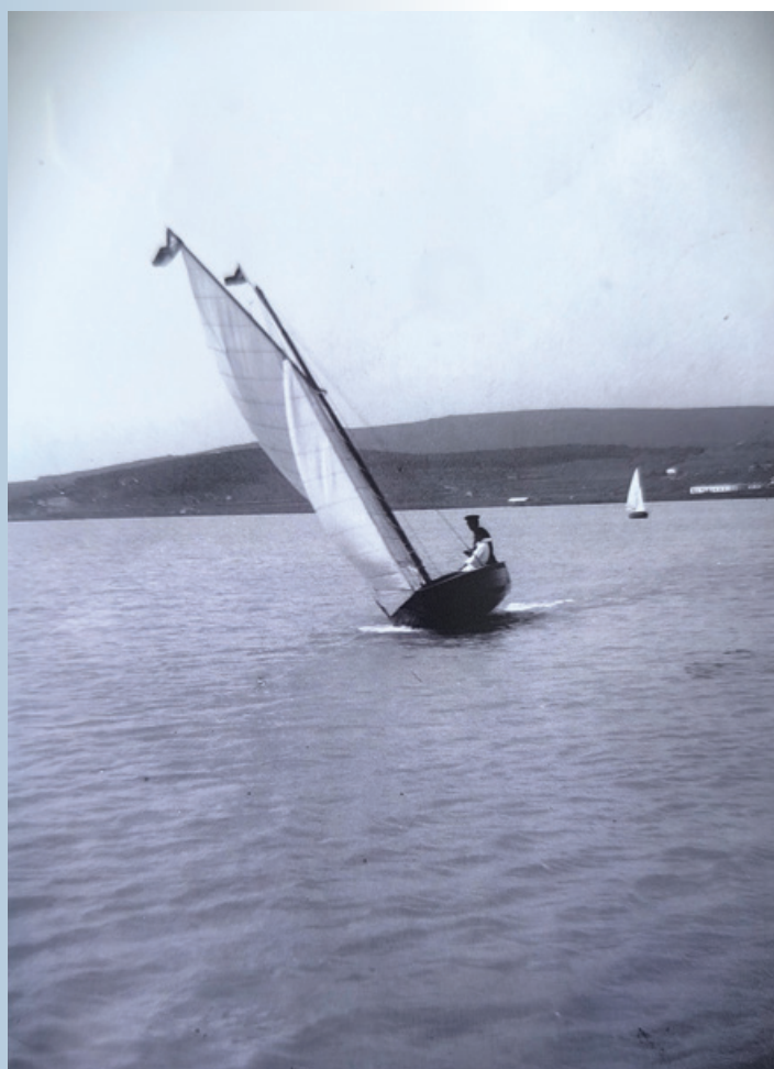
Az almádi öbölben 1916

A Honismereti Szakkör 100 éves a Yacht Club c. kiállítása május 31-ig látható a Pannóniában.