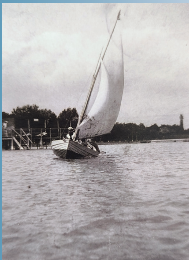
A régi almádi strand előtt 1916