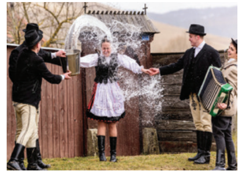
A világhálón található sok-sok húsvéti képen azért látható, a vízzel sem takarékoskodnak!

A lengyel húsvét mind a mai napig olyan hagyománytisztelő, hogy akár példát is vehetnénk tőlük a szomszédaik. A Virágvasárnapot ők „Pálmavasárnapnak” nevezik, de éghajlati okokból hozzánk hasonlóan fűzfaágakkal és barkákkal díszítik fel, amelyeket előzőleg megáldottak a papok. Még a városi otthonokban is megőrzik ezeket a megszentelt barkákat legalább egy évig a szentképek mögé tűzve, de amint megérkeznek az újak, a régieket elégetik. Jelképesen elégetik Júdást is, akinek a bábuját sok helyen a templomtoronyból dobják le. Másnap náluk is elnémulnak a harangok: helyettük kereplők szólnak egészen nagyszombatig. Addig viszont sem sípolni, sem tamburázni nem szabad. Ebben az ünnepi csendben sétálnak le a folyókhoz nagypénteken, hogy megtisztuljanak és pácolt heringet fogyaszt a legtöbb család. Én ugyan Serockban még nem jártam, de a lengyel tojáskrémet Tarnowban és itthon is megkóstoltam, sőt el is készítem. Nem nehéz, ha van hozzá elég lilahagyma, majonéz és snidling.