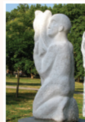
Tania Ivanova: Fiú és sólyom

Kecske tova néz kővé vált mozdulatok park örök idők.