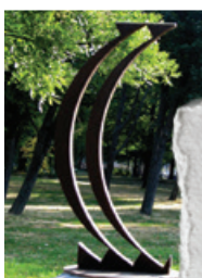
Horváth László: Azonosulás