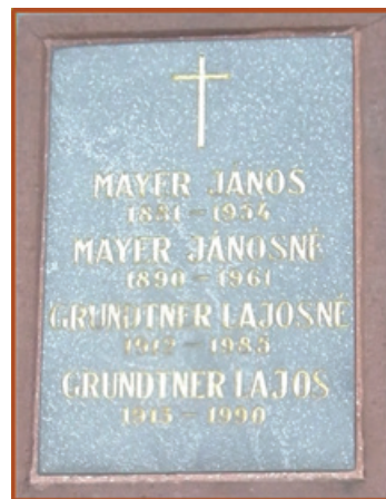
Az ősök sírfelirata a Szent Imre templom sírkertjében