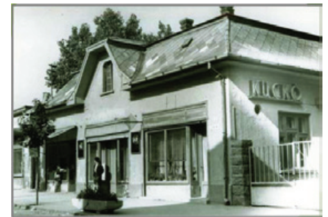
A Kuckó cukrászda 1965-ben készült fényképen.