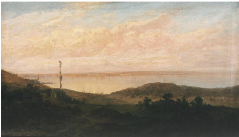
Telepy Károly: Alkonyat az Almádi parton • A kép forrása: https://www.hung-art.hu/

a csapóajtót lezárta a háziasszony. Közben a Marcsa megterített és lassan elkészült a vacsora. A két asszonyt is helytel kínálta a betyár. A többiek illedelmesen csendben hallgattak, csak Patkó beszélt. Ahogy fogyott a bor, halkán nótázni kezdtek, majd úgy 11 óra felé illedelmesen elköszöntek. Megköszönték a bort meg a szíves látást. Semmihez hozzá nem nyúltak. Mikor Tamási Marcsa becsukta az ajtót, még hallotta, hogy az egyik betyár így szólt a vezérnek: - Bezörgetek öreganyámhoz, itt lakik a sárkuti dülöben! Nagyon sóhajtott a két asszony és lassan a jól megérdemelt nyugovóra tértek. A portyázó betyárok emlékét őrzi még ma is élő, kedves kis dal: A sárkuti patak partján születtem, Pacsirta sírt altatódal fölöttem, Kis pacsirta, dalos madár, öreglegény, Elmúlt a nyár.