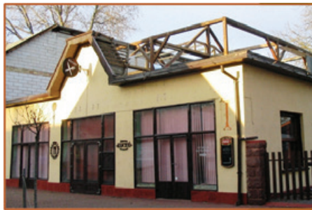
Az átalakított Kuckó cukrászda már, mint Kuckó étterem

Balatonalmádi lokálpatrióta polgárai, de a városba látogatók, nyaralók egyaránt aggódva figyelik a belváros alakulását. 2022-ben több médiumban is megjelent a hír, miszerint: „Balatonalmádiban nagy felháborodást váltott ki, hogy a Balaton-parti üdülőváros központi terén, a nyaralók és az almádi lakosok körében is közkedvelt szökőkút szomszédságában lebontásra ítélték az egykor szebb napokat látott kultikus Kuckó éttermet” - (valójában az egykori cukrászda épületét).