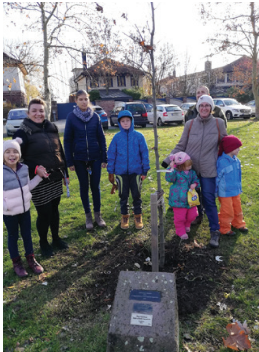
Nagycsaládosok fájának átültetése - 2019.

érdekeinek képviselője és szolgálata. Fontos számunkra, hogy megmutassuk a társadalomnak azokat az értékeket, amelyeket a nagycsaládosok képviselnek, valamint, hogy a nagycsaládosok egymást ismerő és segítő közösséggé szervezzük. Pályázataink is ezt a célt szolgálják. Az elmúlt években számos olyan projektet vittünk véghez, amely a családok hétköznapjait segítette, valamint munkaerő-piaci szolgáltatásokat nyújtott főként a többgyermekes édesanyák számára.