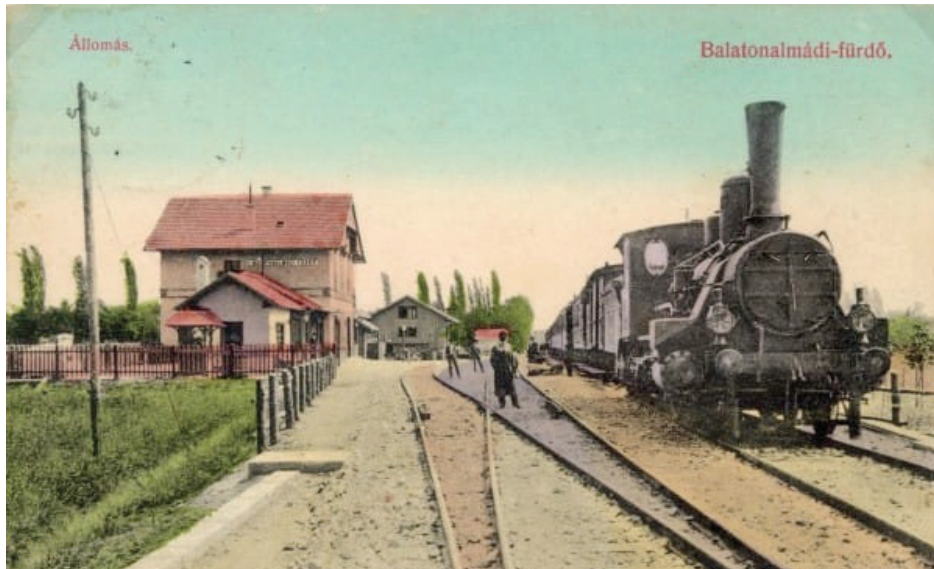
Képeslap a balaton-felvidéki turizmus hajnaláról

Állítólag bitang drága a Balaton, sehol semmi, nem is volt program és egyre züllik kender-magos kivárosunk kulturális kínálata. Divat lett viszketeg celebek, unatkozó úrgazdagok és más mindent-is-jobban-tudó alakok között a Balatont ócsárolni, összevetni más tavakkal vagy tengerekkel. A recept egyszerű: Balatonunk leértékelése, majd a horvát tengerpart meg Mallorca mennybemenetele. Ne kövessük átlátszó, kisszerű és izzadságszagú igyekezetüket. Ne repüljük se a magyar tenger, se a városunkat, legalább mi nem! Nagyon sok lokálpatrióta